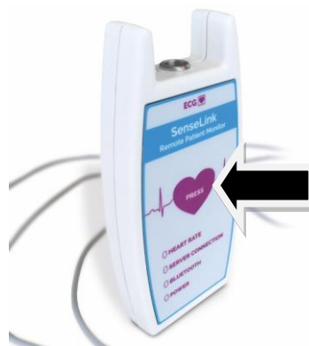
Afbeelding 2: eventknop om te drukken bij klachten

Hebt u erge klachten? Wacht niet tot het inleveren van de apparatuur, maar bel het ziekenhuis. Bij spoed belt u 112.