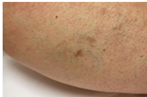
Foto's van resultaat na 1 behandeling